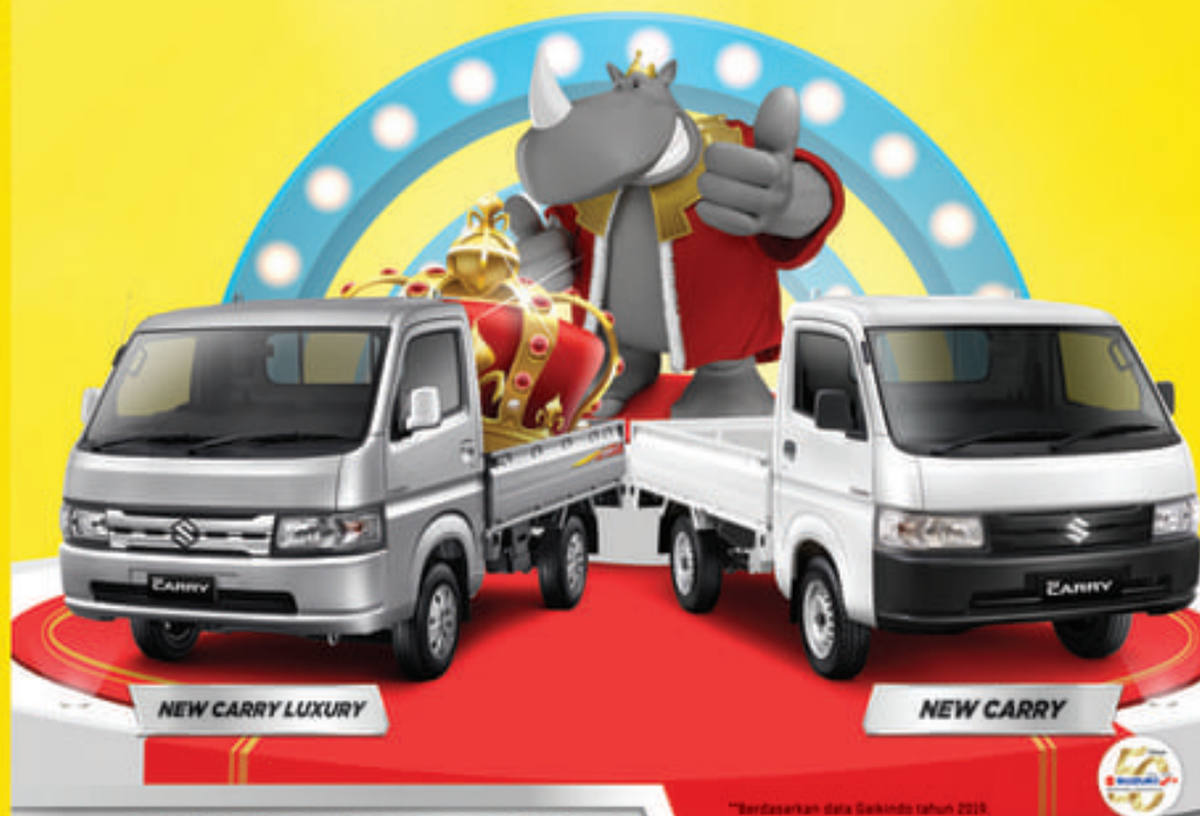
NEW CARRY LUXURY